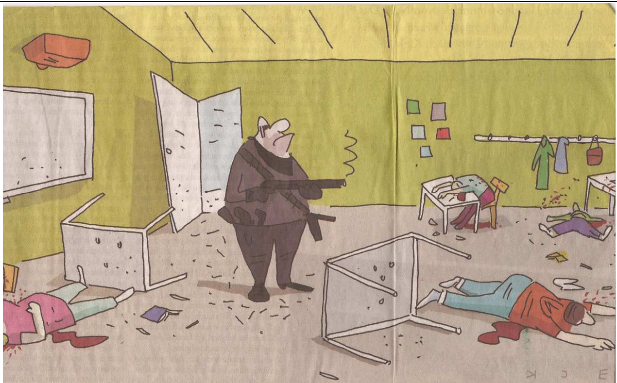
TTIP: Sieg der Gerechtigkeit. Amerikanische Rüstungsinvestoren haben erfolgreich für mehr Waffengebrauch in Europa geklagt.