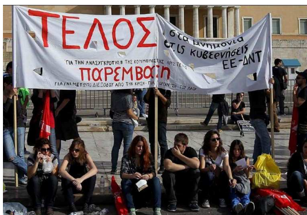
Griechenland unter Spardiktat: Zukunft?

Der Großteil der Bevölkerung in Griechenland hat genug von den brutalen Sparmaßnahmen, die hinter und auf ihrem Rücken getroffen werden. Deshalb hat die Mehrheit, insbesondere die ArbeiterInnen, Arbeitslose, Jugendliche, Frauen und MindestpensionistInnen die